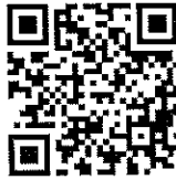
QR Code ตอบแบบสอบถามความพึงพอใจ ๒๕๖๗

โดยทำการตอบแบบสอบถามความพึงพอใจทั้ง ๔ ด้าน ดังนี้ ๑. ด้านวิชาการ ๒. ด้านงบประมาณ ๓. ด้านบริหารงานบุคคล และ ๔. ด้านบริหารงานทั่วไป โดยทำการเข้าตอบแบบสอบถามได้ ตั้งแต่บัดนี้เป็นต้นไปจนถึงวันที่ ๑๕ กันยายน ๒๕๖๗ ที่เว็บไซต์ของ สพฐ. ตาม QR Code ที่แนบมาพร้อม